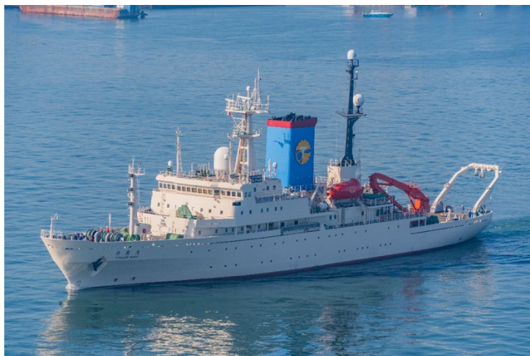
写真1：学術研究船「白鳳丸」