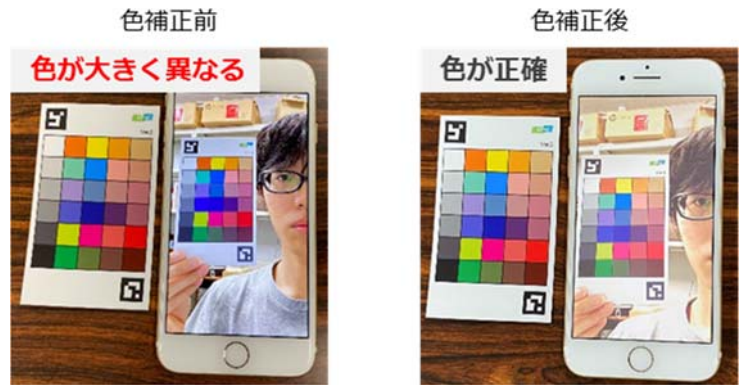
図3：カラーチャートを用いて色補正を行った結果（色補正前では手元と画面上のカラーチャートの色が大きく異なるが、色補正後には画面上のカラーチャートの色が正確に表示される）

比較的低コストで容易に制作が可能なカラーチャートの配布という、従来の枠にとらわれない極めてシンプルなイノベーションで、遠隔診療の高品質化を実現できる点が本成果の特色です。