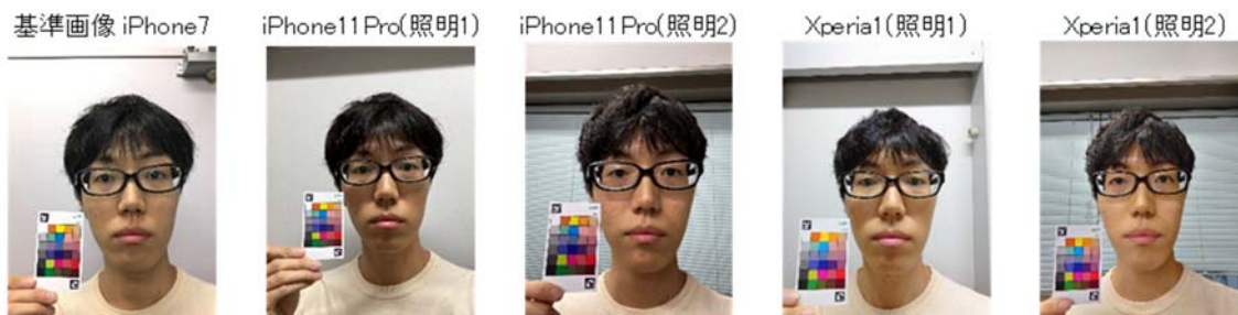
図2： スマートフォンのカメラを通じた顔画像の例。機種や照明によって色の違いができてしまう

しかし、スマートフォンなどのビデオ通話では、デバイスの特性や患者の居場所の照明によって色の違いが起きてしまいます(図2)。このことは、遠隔で視覚情報をもとに診察を行うにあたって大きな障壁でした。