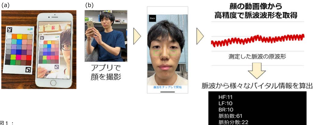
図1： (a)カラーチャートを使用した顔画像の色補正 (b)スマートフォンを用いた非接触バイタルセンシングの流れ。ここでは心拍数、脈拍数、自律神経指標 注2) の計測に成功

この成果の一部は、「Artificial Life and Robotics」にて、2020年7月21日に公開されました。