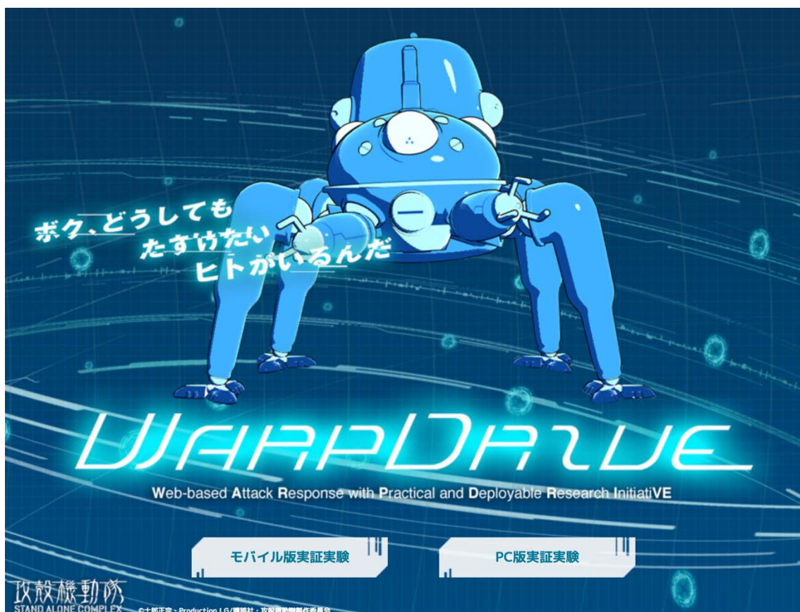
図 1 WarpDrive ポータルサイト ( https://warpdrive-project.jp )

⇒タッチコマ・モバイルのダウンロード ( https://warpdrive-project.jp/mobile-app/ )