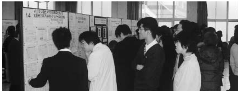
ポスターセッション形式で研究発表 ＝薬学講堂