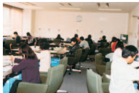
入学願書の受付業務に忙殺される事務局職員 =1月31日、事務局第二会議室