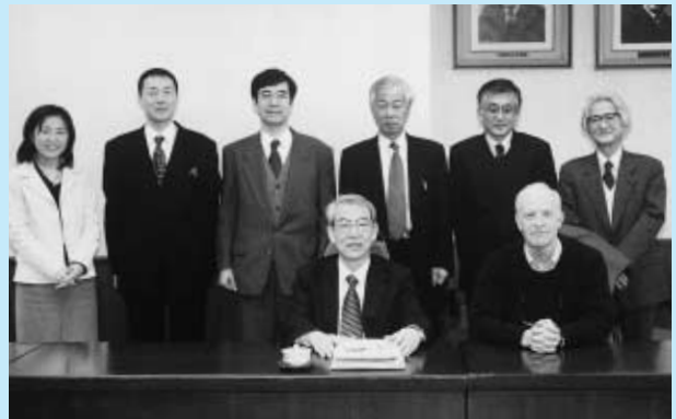
マルキン教授と本学関係者