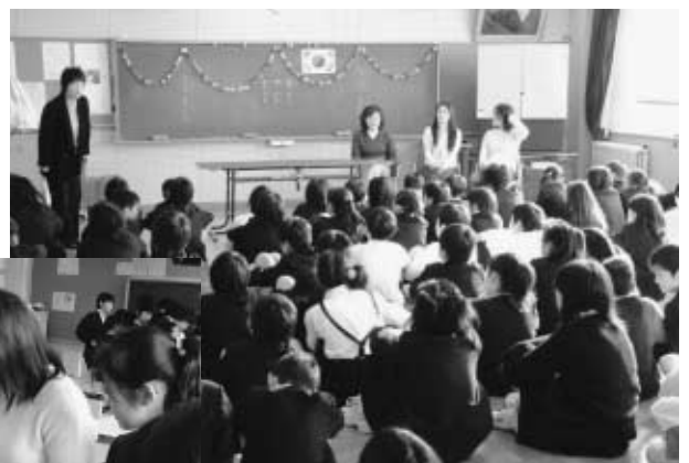
外国人留学生との交流風景 ＝12月20日、額小学校