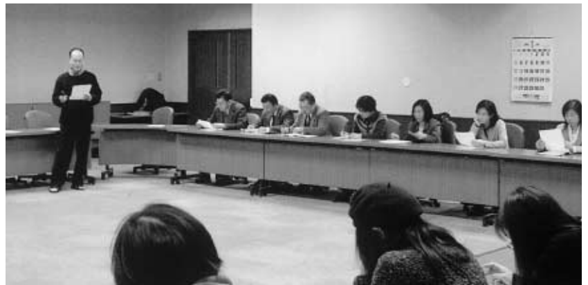
「ジェンダーへの気付き」に関するワークショップ =事務局大会議室

1月28日、「ジェンダー・ハラスメントに関する広報担当者研修会ー男女を平等に表現していますかー」が開催され、29名の教職員が参加した。