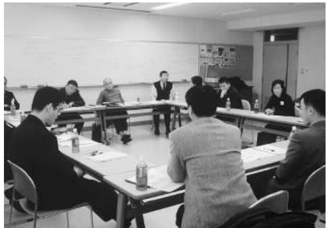
熱心に協議する社会教育主事ら ＝1月25日、国立能登青年の家

これは、市町村教委や公民館等の社会教育施設で任務を遂行している社会教育主事に社会教育や生涯学習に関する最新の情報を提供するとともに、ワークショップ等を通じて相互の啓発の機会とするなど、社会教育主事への支援を目的に実施したもので、石川、富山、岐阜等の各県から24名の参加があった。