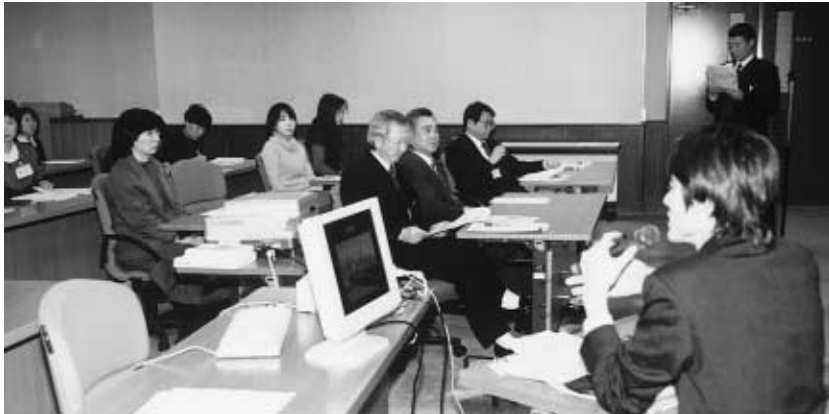
質問に答える白木事務官 =事務局大会議室

1月9日、文部科学省国際競争力経費海外マネジメント研修事業により実施した研修の報告会が行われた。