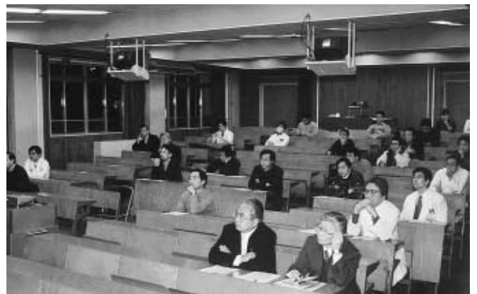
検討委員会の報告を聞く出席者 =1月24日、医学部基礎第一講義室