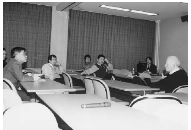
授業改善について意見交換 =1月23日、工学部秀峯会館中会議室