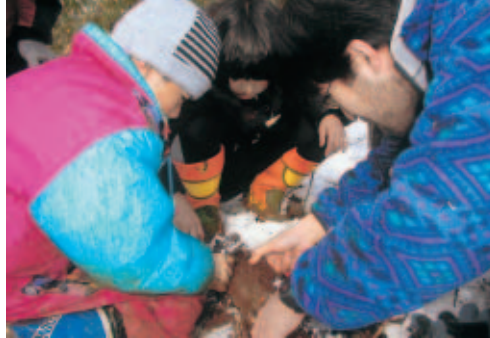
越冬中の昆虫を観察する参加者