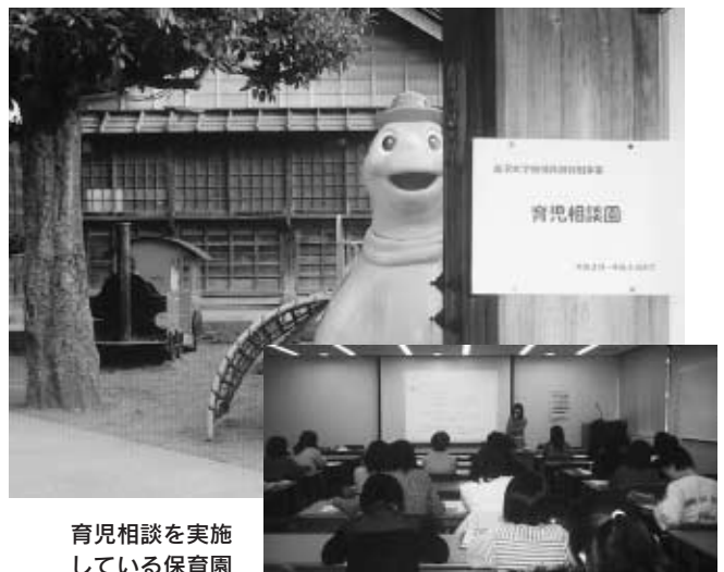
育児相談を実施 している保育園

また、教育実践総合センターのスタッフを中心に、金沢大学サテライト・プラザを会場に、中学校・高校生など思春期で悩む子を持つ保護者や学校関係者向けの「思春期相談室」を、1月から開設している。毎週2回の相談室に申し込みが多く来ている。