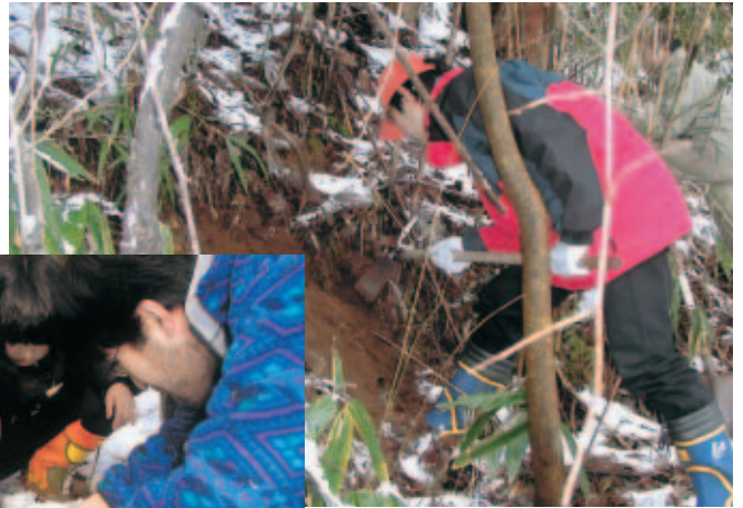
土を掘る生態学研究室学生

ずぶの素人が闇雲に土を掘れば見つかる というものではないが、生態学研究室に学 ぶ学生諸君らにはそのあたりの知見は蓄積 されている。クロナガオサムシ、ゴミムシ の仲間、ハサミムシの仲間、大型甲虫の幼 虫、オオムラサキやゴマダラチョウの幼虫 などが観察できた。