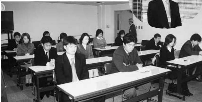
開講式で説明を聞く中堅職員 =1月27日、事務局第一会議室