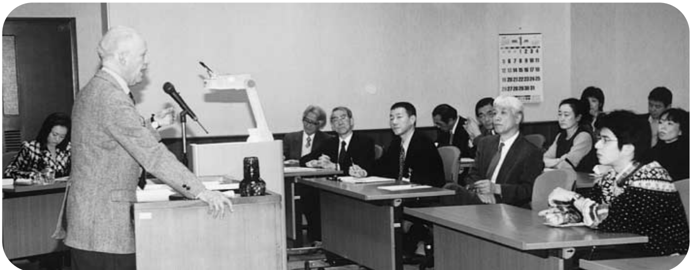
全学対象の特別講演会 =1月22日、事務局大会議室