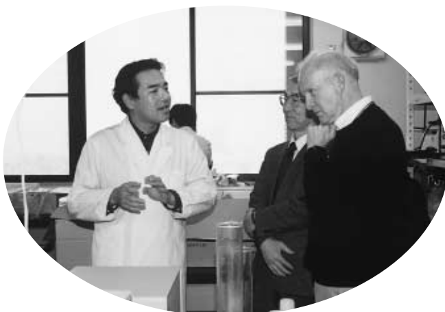
理学部の実験について質問 =1月21日、理学部生物学実験室