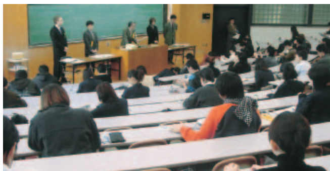
外国語試験に臨む受験者 =1月18日、文・法・経済学部試験場第1試験室(A101講義室)

1月18日、19日、石川県地区では本学を含めて6大学11会場で平成15年度大学入学者選抜大学入試センター試験が行われ、初日の第1時限目の外国語には、角間、小立野、宝町の各キャンパスで計3,915名が受験した。