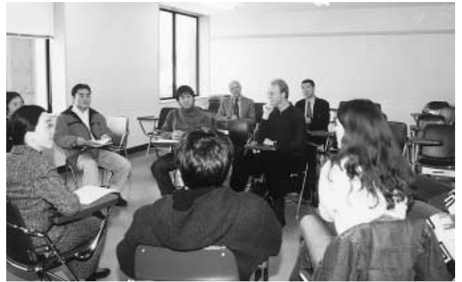
教養的科目の授業を視察 =1月22日、総合教育棟D11演習室

受けるもので、全学対象の特別講演会、理学部、工学部及び教養教育の授業・実験の視察、理・医・薬・工学部各教官との意見交換会を行った。