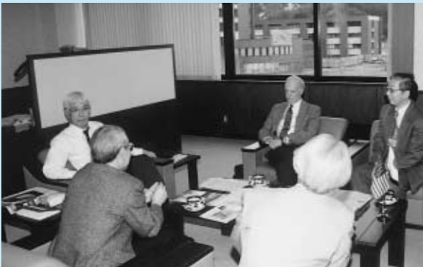
海外アドバイザーとして招聘した カリフォルニア大学バークレー校のリチャード・マルキン教授