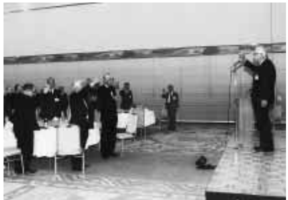
乾杯の音頭をとる東正雄名誉教授(元教育学部) = 同左