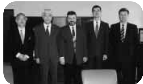
ロシア・モスクワ大学哲学部長ヴラジミル・ミロノフ教授(写真中央) = 11月30日、学長室で