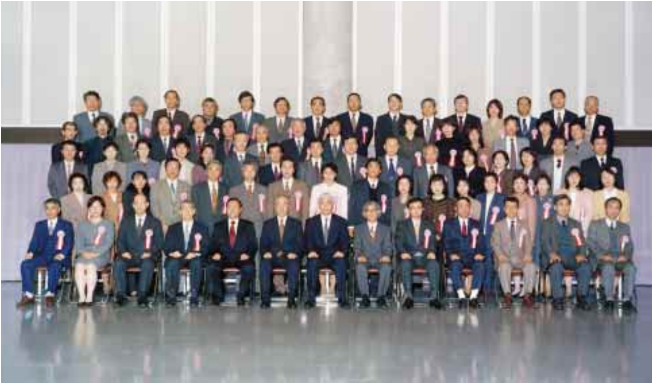
永年勤続者表彰を受けた方々 = 11月24日, 大学会館で( 関連記事は3ページ)