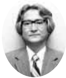
学長 補佐 (法学部教授)