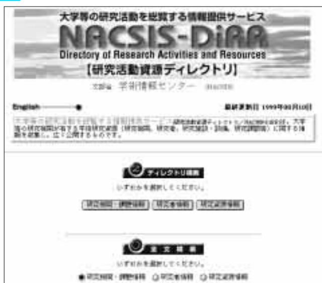
「研究活動資源ディレクトリ」のトップページ