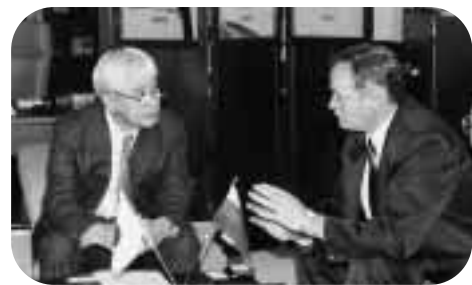
ロシア科学アカデミー極東支部副総裁バレンチン・セルギエンコ教授(写真右) = 11月26日、学長室で