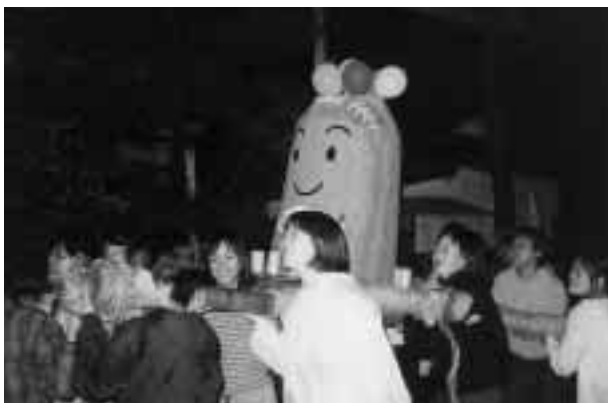
趣向を凝らした各寮のみこしをかつぐ白梅寮生たち = 11月13日、白梅寮周辺で

その後、寮生たちは、泉学寮も加わって3寮合同で手作りみこしをかつぎ、大通り沿いを掛け声も勇ましく練り歩き、祭を楽しんでいた。