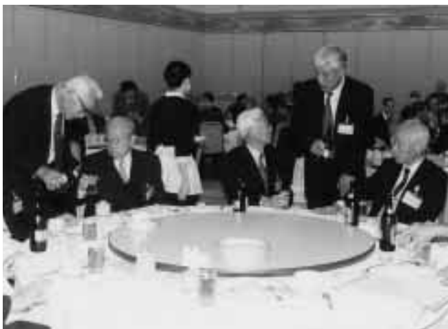
和やかに進んだ懇談会の様子 = 11月16日、ホテル日航金沢(金沢市本町)で

11月16日、市内のホテルを会場に、恒例の「学長と名誉教授との懇談会」が催され、58名の名誉教授の皆さんが、各々懐かしい思い出話や近況を語り合って、旧交を温めた。