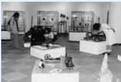
手に取って、間近で見ることができるよう低い位置に配置された展示物 = 11月2日、資料館で

今回は“見る”だけでなく、“hands on(ハンズ オン)”として、実際に触って当時さながらの実験を体験することができる。器械の少なかった昔の工夫と知恵が実感でき、実におもしろい。一見の価値有り。