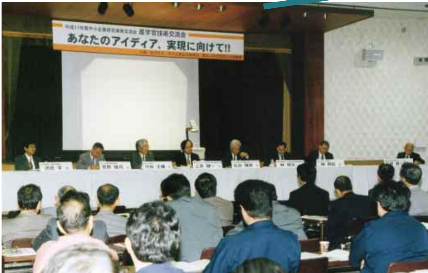
産学連携について意見を交わすパネリスト = 11月10日、工学部秀峯会館で

11月10日、金沢大学、中小企業総合事業団(財)石川県産業創出支援機構の共催で「産学官技術交流会 - LINK21 -」を工学部秀峯会館で開催した。“産学連携による大学の社会貢献”と“企業と大学の技術交流”を目的に、北陸地方では初の試みとなった同会では、講演やパネルディスカッションを通じて、技術移転の必要性や産・学の様々な違いなどを意見交換することができ、参加者は150人を超えるほどの盛況であった。