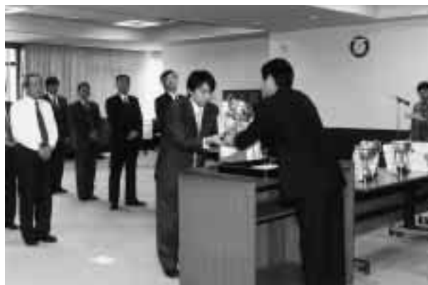
ソフトボール優勝の表彰を受ける職員 = 11月19日、事務局大会議室で