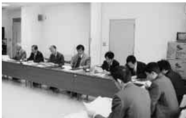
活発な意見交換が行われた懇談会の様子 = 11月10日、教育学部附属教育実践総合センターで