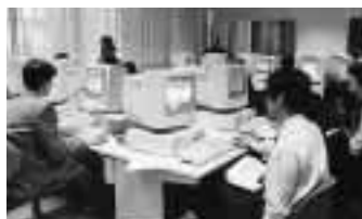
ホームページ作成の実習を受ける受講者 = 11月29日、総合情報処理センターで

期 日: 11月29日 ~12月3日 受講者: ホームページ実務 担当(予定)者 23名 場 所: 総合情報処理 センター