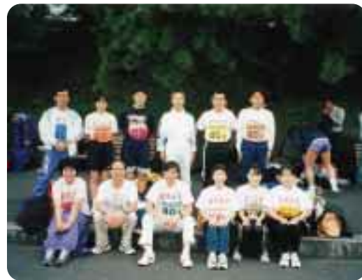
力走を誓って記念の一枚 = 11月6日, 皇居桜田門内で