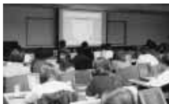
「ワード」の研修風景 = 11月16日、事務局大会議室で

期 日: 11月16日~18日 受講者: パソコンを利用する 事務職員3コース 149名 場 所: 事務局大会議室