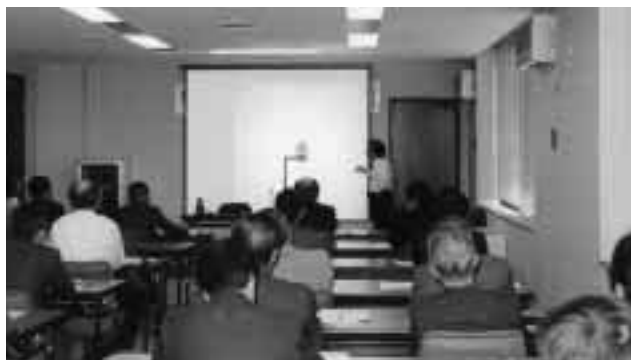
熱心に耳を傾けるたくさんの参加者 = 11月12日、総合教育棟で