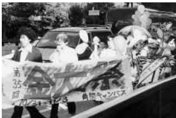
恒例の仮装で街中を練り歩く金大生 = 10月30日, 香林坊付近で

今回はメイン企画として, 芥川賞作家の辺見庸氏が「世界の虚偽と独り旅の可能性について」と題して講演を行い, 会場には約250人の学生らが集まった。