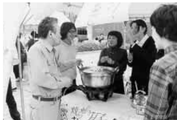
客との掛け合いが楽しい模擬店の様子 = 10月31日, 大学会館前広場で