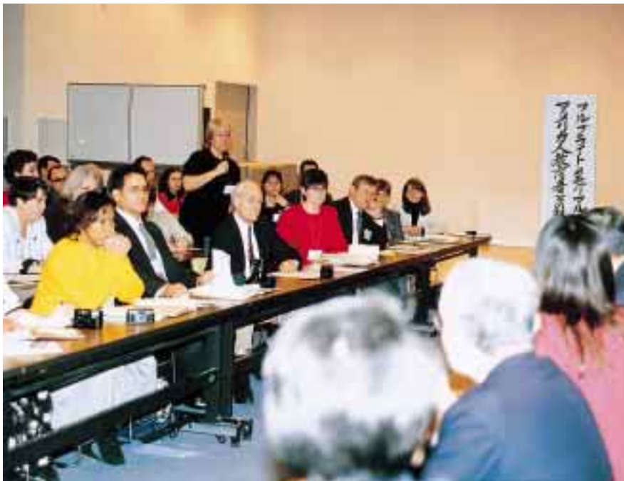
全体集会で意見交換をする日米両国の教諭 = 同上