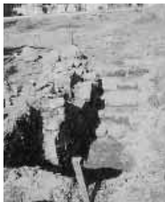
二の丸石室跡「くぐり抜け階段」