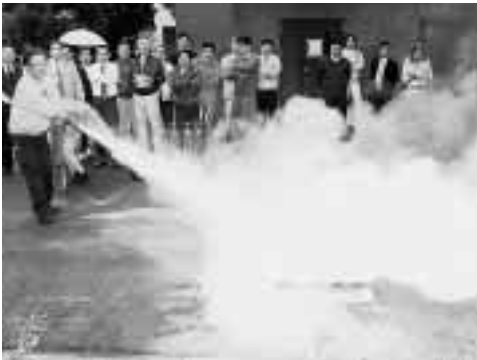
消火器を使っての消火訓練の様 = 11月11日,本部棟横で