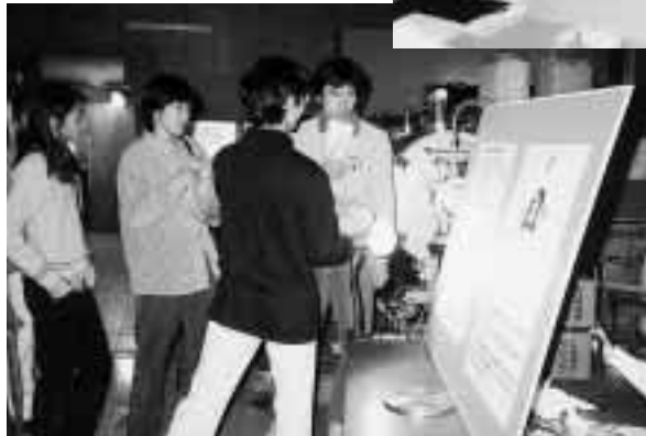
物質の第4の状態であるプラズマの作り方の解説・実験(物理学科) = 同上