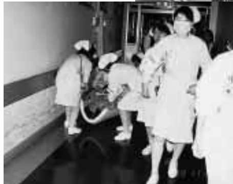
避難誘導訓練の様 = 11月27日,医学部附属病院病棟で