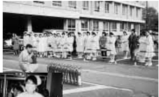
消火器について真剣に説明を聞く参加者 = 同左

11月11日,事務局・学生部で火災予防訓練が実施され,初期消火の基礎訓練が行われた。また,13日には医学部医学科で,26日には同保健学科で,27日は医学部附属病院でも防火訓練が行われ,参加した教職員はそれぞれ真剣な表情で取り組んだ。