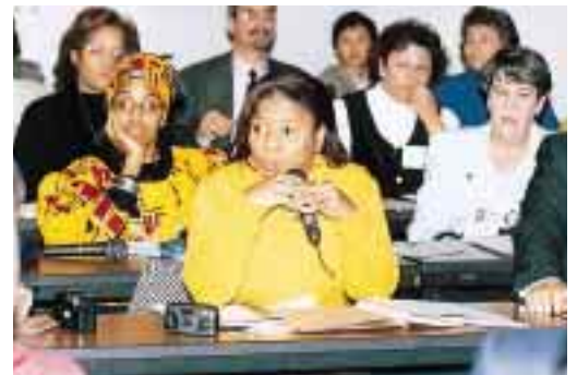
質問をする米国教諭 = 同上