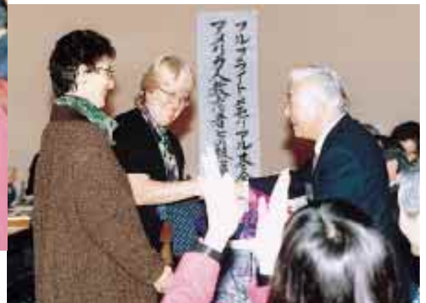
握手を交す米国教員一行の代表と岡田学長 = 同上