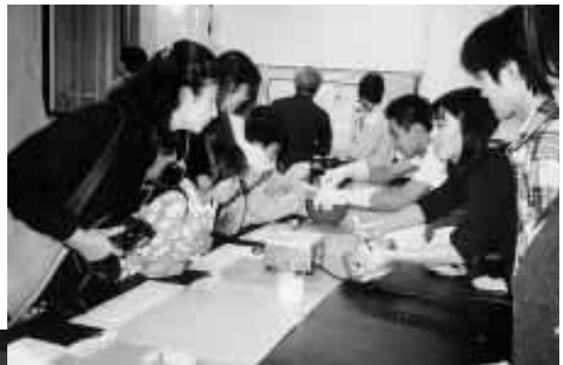
最古の加工食品であるチーズ作りに挑戦(化学科) = 11月1日、理学部で

6回目となる今回は、「数学相談コーナー」(数学科)、「氷の部屋」(物理学科)、「チーズを作ろう」(化学科)、「植物も眠る」(生物学科)、「岩石を知ろう」(地球学科)、「コンピュータで遊ぼう」(計算科学科)など、全部で22の趣向を凝らしたコーナーを学生が主体となって開設して実演などを行い、中学・高校生や親子連れら約600人が日ごろなじみの薄い理学の一端を楽しんだ。