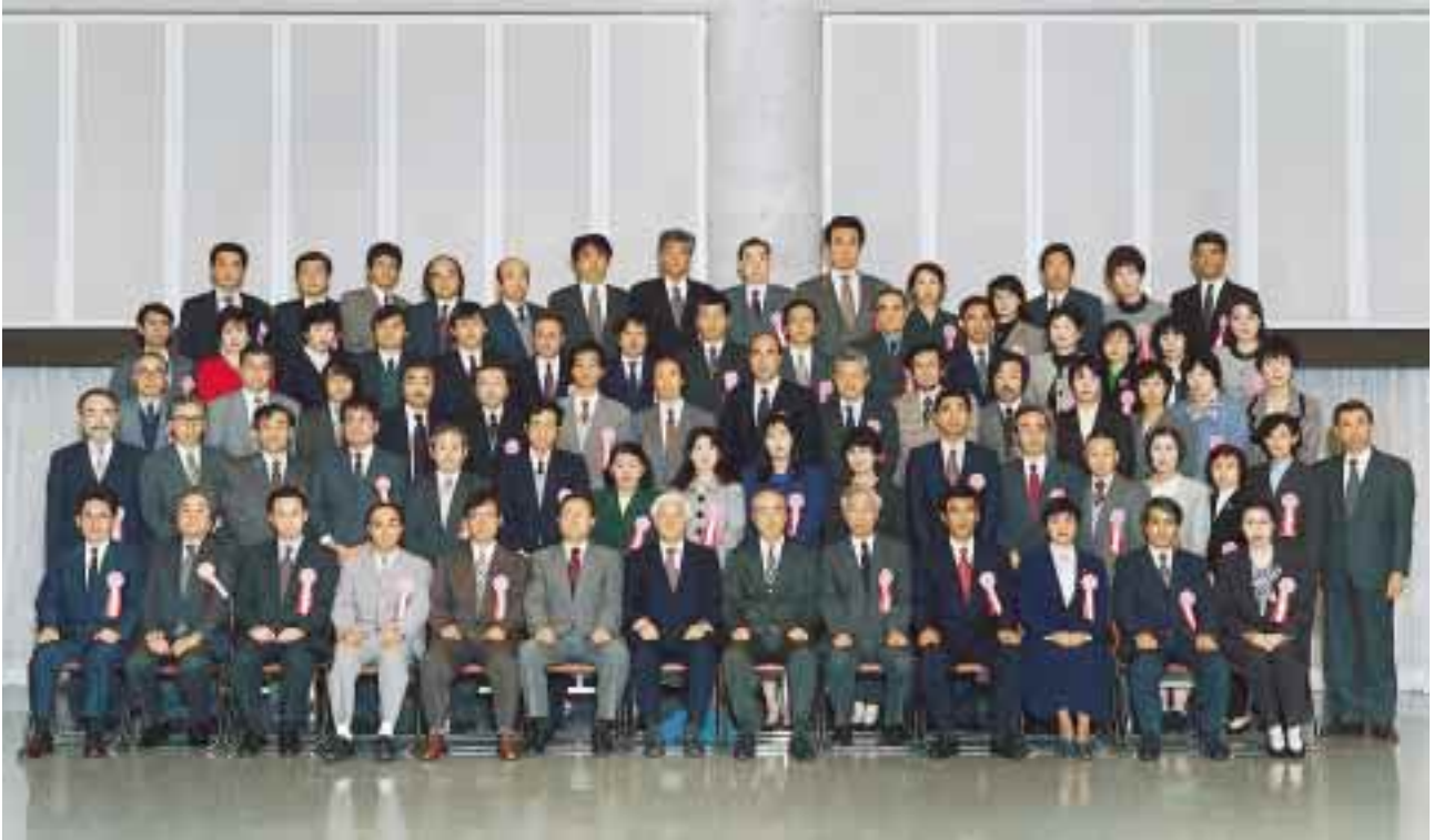
永年勤続者表彰を受けた方々 = 11月24日，大学会館ホールで(関連記事は3ページ)