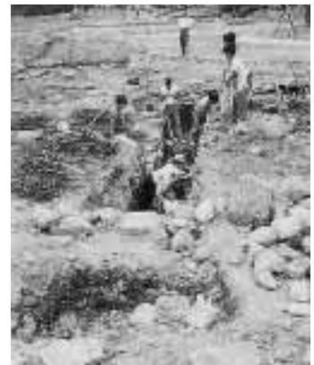
二の丸石室跡の調査風景

註) * 城内キャンパス法文学部と附属図書館に囲まれた一帯。 ** 石室の遺構は、長さ813cm、幅103~95cm、深さ約220cmで、この場所には約18の地下水の湧出があった。