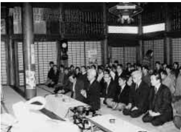
しめやかに執り行われた慰霊法要 = 11月12日,善徳寺(金沢市石引)で

この法要は,ここ1年間に医学の発展のため命を捧げた実験用動物を弔うもので,医学部,薬学部及びがん研究所の共催で毎年実施している。読経の流れ中,参加者は順次焼香を行い,それぞれの想いを巡らせていた。