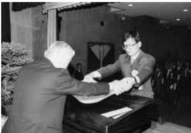
岡田学長から表彰状を受け取る被表彰者総代 = 11月24日、大学会館ホールで

11月24日、大学会館ホールにおいて、「平成10年度永年勤続者表彰式」が行われた。