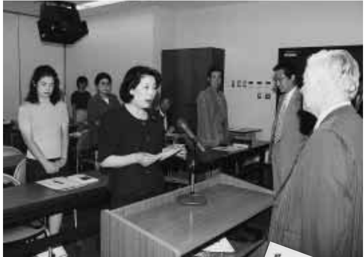
テレビ講座開講式で“ちかいの言葉”を述べる受講生代表 =9月14日午後、大学教育開放センター講義室で