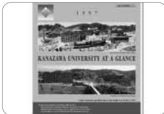
「KANAZAWA UNIVERSITY AT A GLANCE」の第1画面