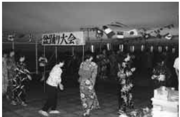
楽しげに輪になって踊る関係者たち = 9月2日夕刻、医学部附属病院屋上で

2時間ほどの集いではあったが、暮れゆく景色を眺めながらの楽しいひとときであった。