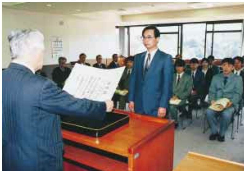
岡田学長から学位記を手渡される論文審査合格者 =9月30日午前、事務局大会議室で