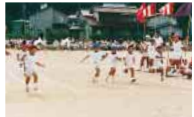
附属小学校の徒競走“ラン・らん・RUN!” = 9月25日, 附属小学校運動場(平和町)で