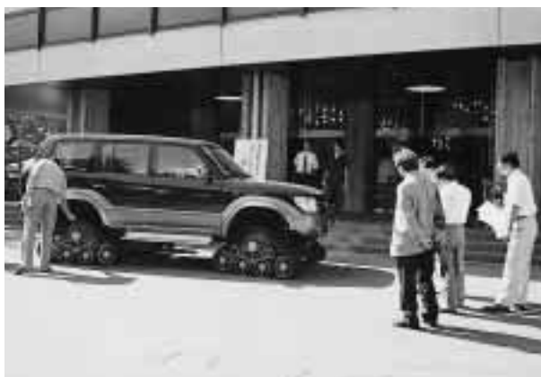
このたびお目見えした“究極のオフロード車” =9月19日午後、工学部(小立野)秀峯会館前で

9月19日、防衛大学の北野昌則教授が開発した“キャタピラーカー”が本学工学部で開催された「先端加工学会」にお目見えした。時速100kmの走行が可能で、45度の雪・泥・砂道でも登ることができる。現在、雲仙普賢岳や桜島の火山灰地で実際に使用されており、来年開催の長野五輪でも威力を発揮するとみられる。