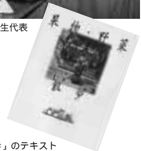
テレビ講座「果物・野菜散歩」のテキスト