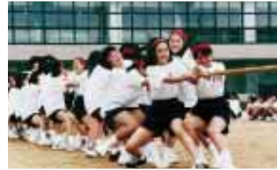
附属中学校の綱引き“私の綱とっちゃいや” = 9月18日, 附属中学校運動場(平和町)で