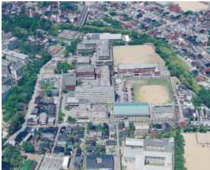
石引通り上空から鶴間キャンパスを望む 本キャンパスには医療技術短期大学部から改組転換した医学部保健学科(平成7年10月設置)がある。近い将来、左隣の宝町キャンパスの病院再開発と併せ、保健学科専用の校舎の建設が予定されている。