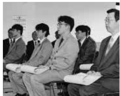
新たに学位を取得した博士の方たち = 同左

9月30日、事務局大会議室で“大学院自然科学研究科学学位記授与式”が挙行された。今回は、課程修了者10名と論文審査合格者10名の計20名(うち外国人2名、最年長は52歳)に学位記が授与され、岡田晃学長から告辞が、花岡美代次研究科長から祝辞がそれぞれ述べられた。