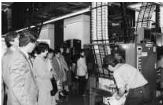
印刷システムを熱心に見学する受講生たち =9月30日午後、北國新聞松任別館(松任市松本町)で

期 日：9月30日 受講者：各部局で広報業務に従事している者 20名 場 所：北國新聞社(金沢市香林坊)