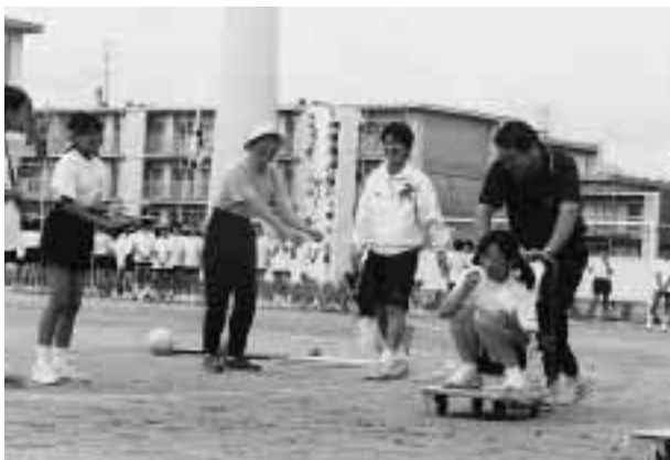
“借り物競争”で、先生に台車を押してもらい指令が与えられた生徒 =9月18日午前、附属中学校運動場(平和町)で

このうち中学校の“借り物競争”では、走りながらのアクションが求められ、見る者を楽しませた。