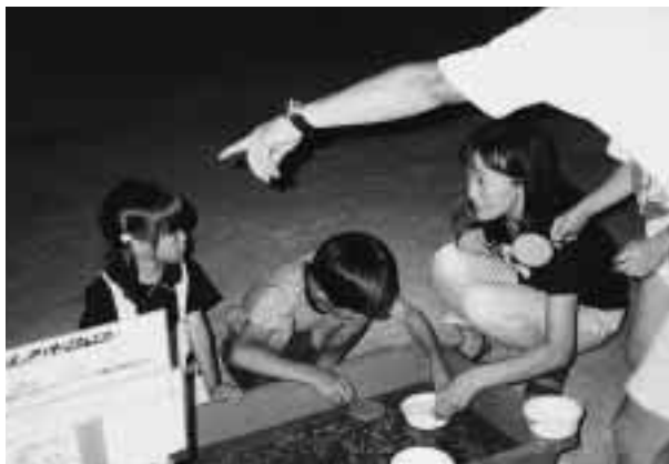
金魚すくいを楽しむ親子連れ =8月3日夜、附属養護学校運動場(東兼六町)で

教育学部附属養護学校(東兼六)で、このほど「いくゆう夏まつり」が行われた。今年は、卒業生による生バンド演奏が組まれて祭りムードを盛り上げたほか金魚すくい、輪投げ、射的などもあってにぎわいを見せた。