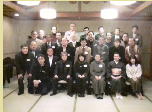
▲ 参加者全員での記念写真