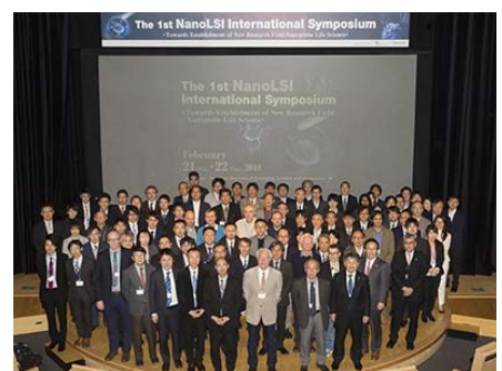
▲1日目の出席者写真

2日間を通じ、NanoLSIの4研究分野それぞれの強みを結集し、生命科学における未踏ナノ領域を開拓していくことを強く発信するとともに、本研究所が国際的研究拠点としてのプレゼンスを高めるための第一歩となりました。