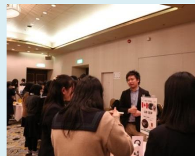
"KU student and high school students enjoying conversation at networking event"

If you are interested in "KU-SGU Student Staff," please email us at <sgu@adm.kanazawa-u.ac.jp> ! International students are welcome to join us!