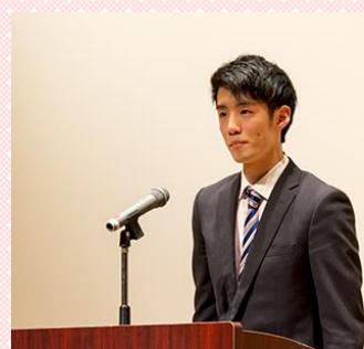
“第6期派遣留学生壮行会にて決意表明をする本学学生”

本学では、学長、教職員、トビタテOB・OGによる面接練習等、他大学にはない手厚いサポート体制が整えられています。