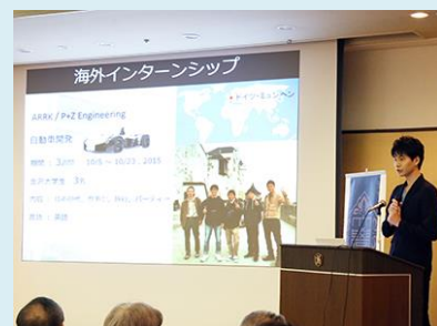
“留学体験談発表の様子”

また、本シンポジウム及び交流会では、当日の司会、ファシリテーター、受付等の運営を含め、企画の段階からKU-SGU Student Staffたちに協力・活躍いただきました。ありがとうございました！