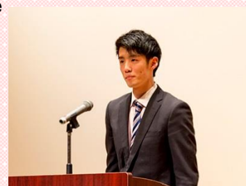
"KU student expressed his determination at the Send-Off Party for the sixth batch."

On February 10 th , the selection result of the sixth batch of "Japan Public-Private Partnership Student Study Abroad Program: TOBITATE! Young Ambassador Program" by MEXT (Ministry of Education, Culture, Sports, Science and Technology in Japan) was announced, and Kanazawa University had 24 successful candidates, which was the 3 rd largest number after Kyushu University (28 candidates) and Waseda University (25 candidates), and the 2 nd among national universities.