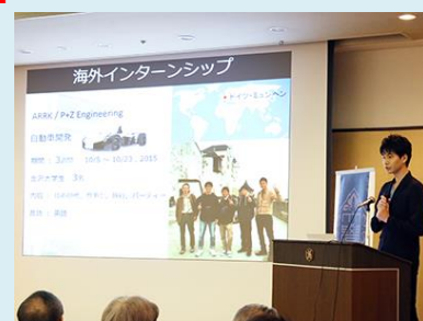
"KU student talking about his study abroad experience"

There are many more events to come which will be planned and operated by KU-SGU Student Staff.