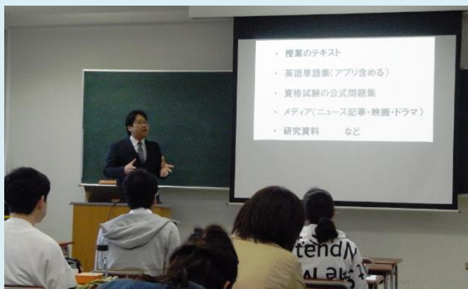
“「英単語学習法（「忘れない！」語彙の増やし方）」での様子”