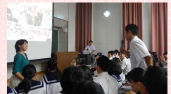
She warmed up audience by communicating with them.