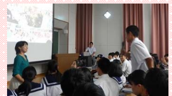
生徒さんとコミュニケーションをとりながら、会場を盛り上げました！

アンケートでは「留学に行きたくなった」「金大の留学制度が思ったよりも充実していることがわかった」といった声が多く聞かれました。今後もこのような活動を実施する予定です。